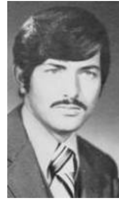
Terry E. Branstad (R)