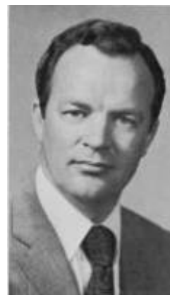
Carl V. Nielsen (D)