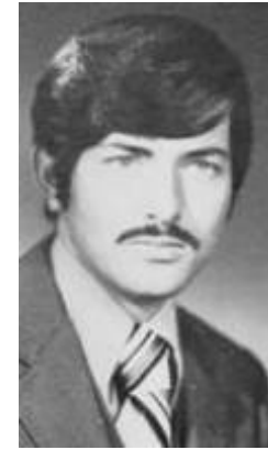
Terry E. Branstad (R)