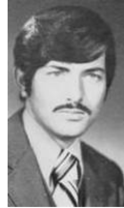
Terry E. Branstad (R)