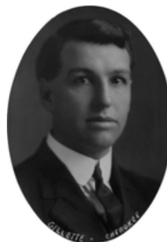
Guy Mark Gillette (D)