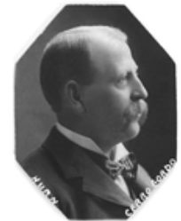
David William Hurn (R)