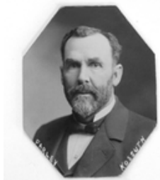
James M. Farley (S)