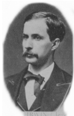
John Nichol Irwin (R)