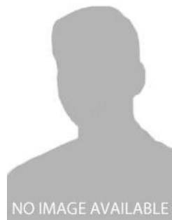
John McHugh (R)